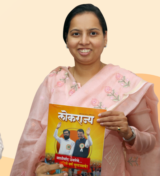
अदिती तटकरे मंत्री, महिला व बाल विकास