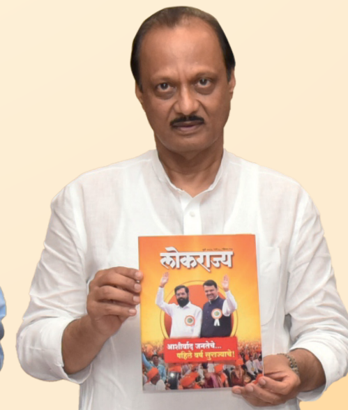
अजित पवार उपमुख्यमंत्री