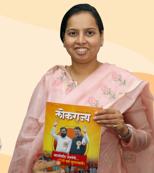
अदिती तटकरे मंत्री, महिला व बाल विकास