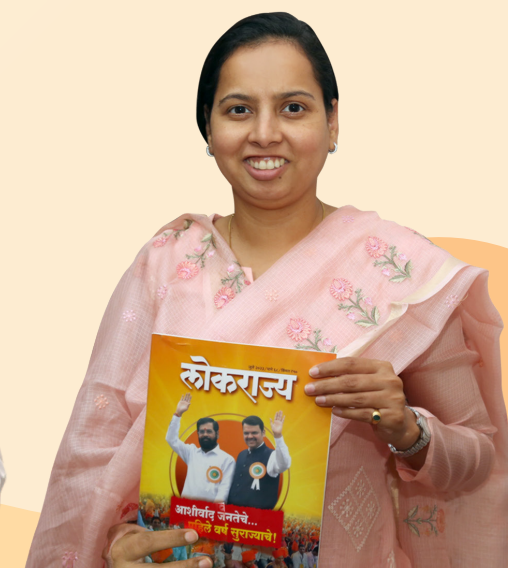
अदिती तटकरे मंत्री, महिला व बाल विकास